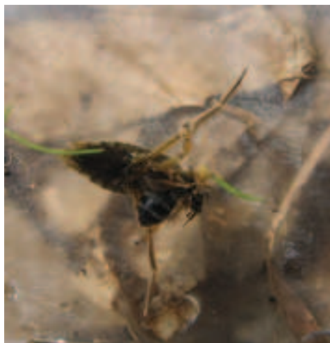
Notonetta intenta a "succhiare" una preda