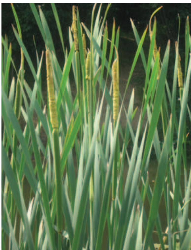
Tifa. Le infiorescenze sono ancora verdi, poi diventeranno marroni