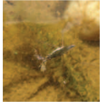
Giovane esemplare di pattinatrice