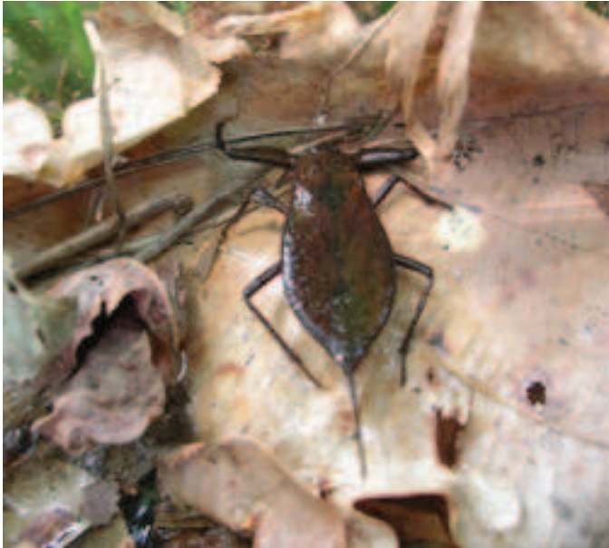
Scorpione d'acqua. Quello che sembra un pungiglione è in realtà un tubo respiratorio