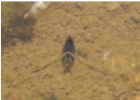
Notonetta. Le lunghe zampe vengono usate come remi